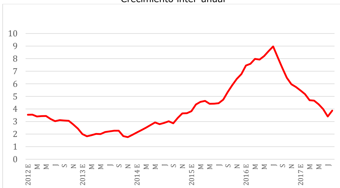
Gráfico 3: Inflación (IPC) Crecimiento inter-anual